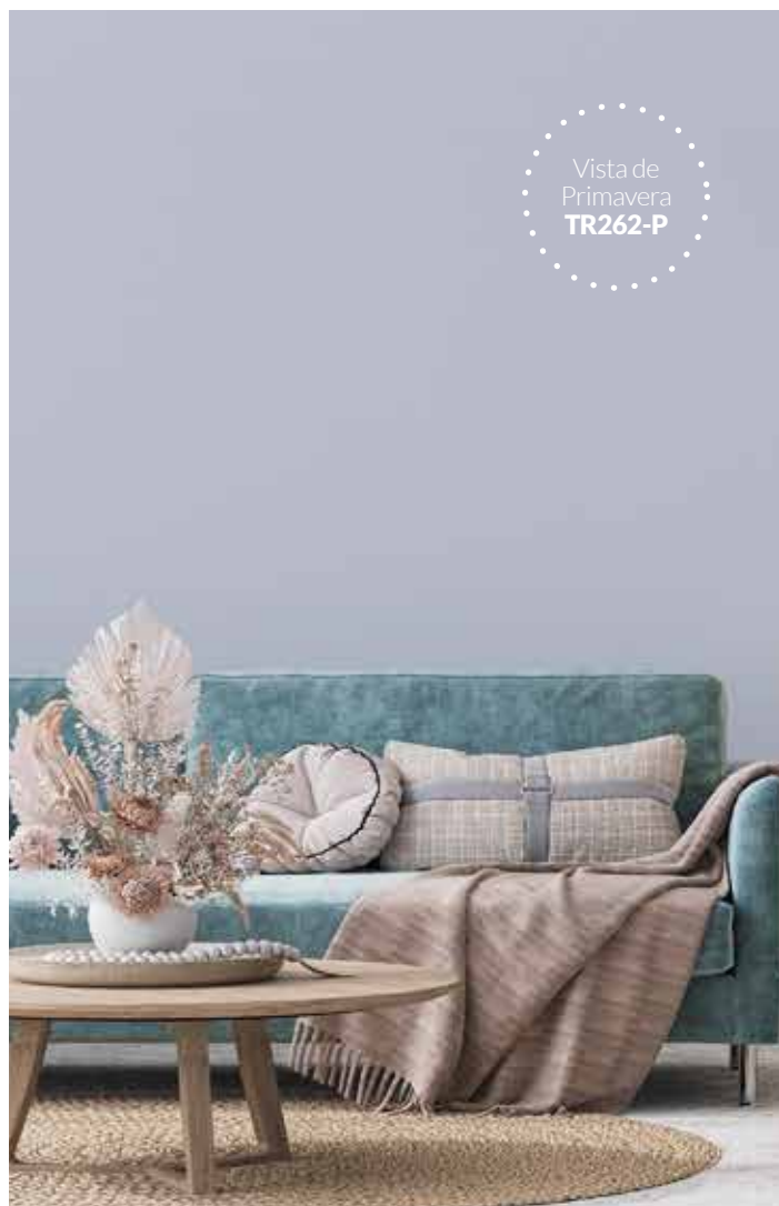
Vista de Primavera TR262-P