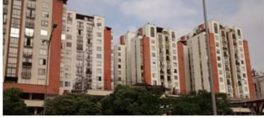
Cerros del Campestre