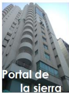
Portal de la sierra