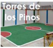
Torres de los Pinos