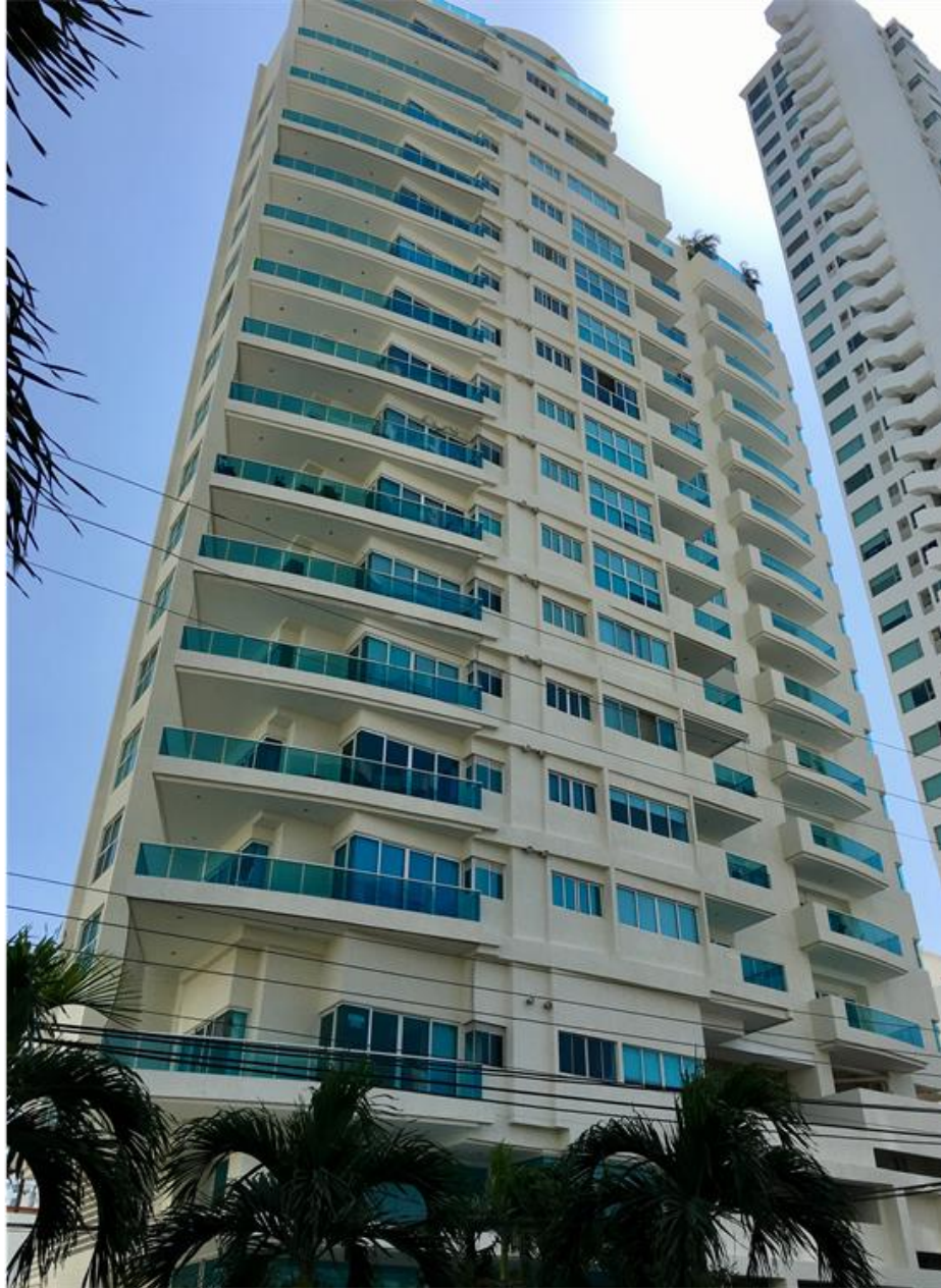
EDIFICIO BAHIA GRANDE