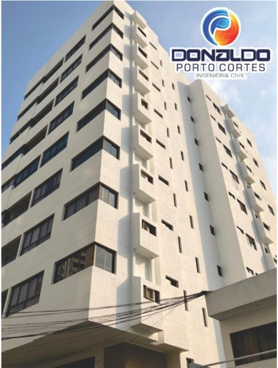
EDIFICIO CARIBE REAL