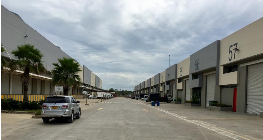
BODEGAS BLOC PORT