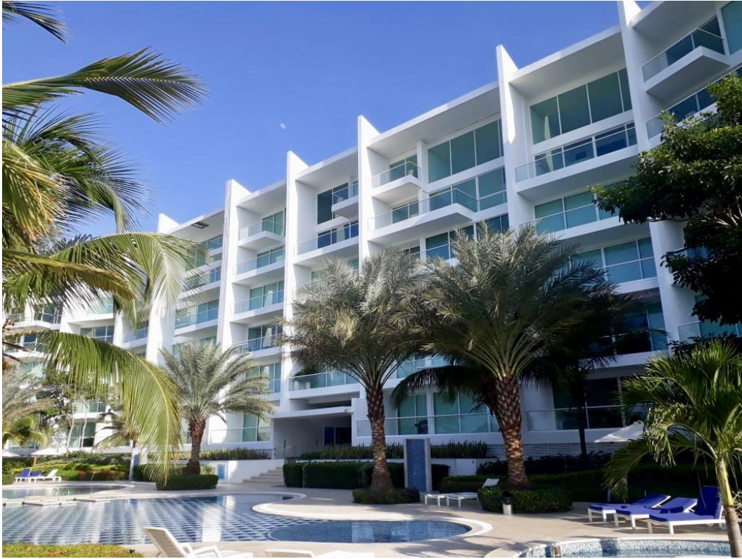
KARIBANA TORRE BAHIA