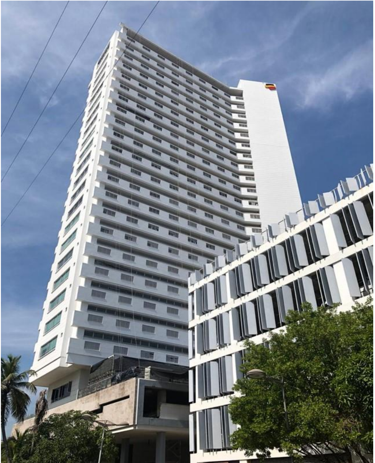
EDIFICIO TWINS BAY TORRE BANCOLOMBIA