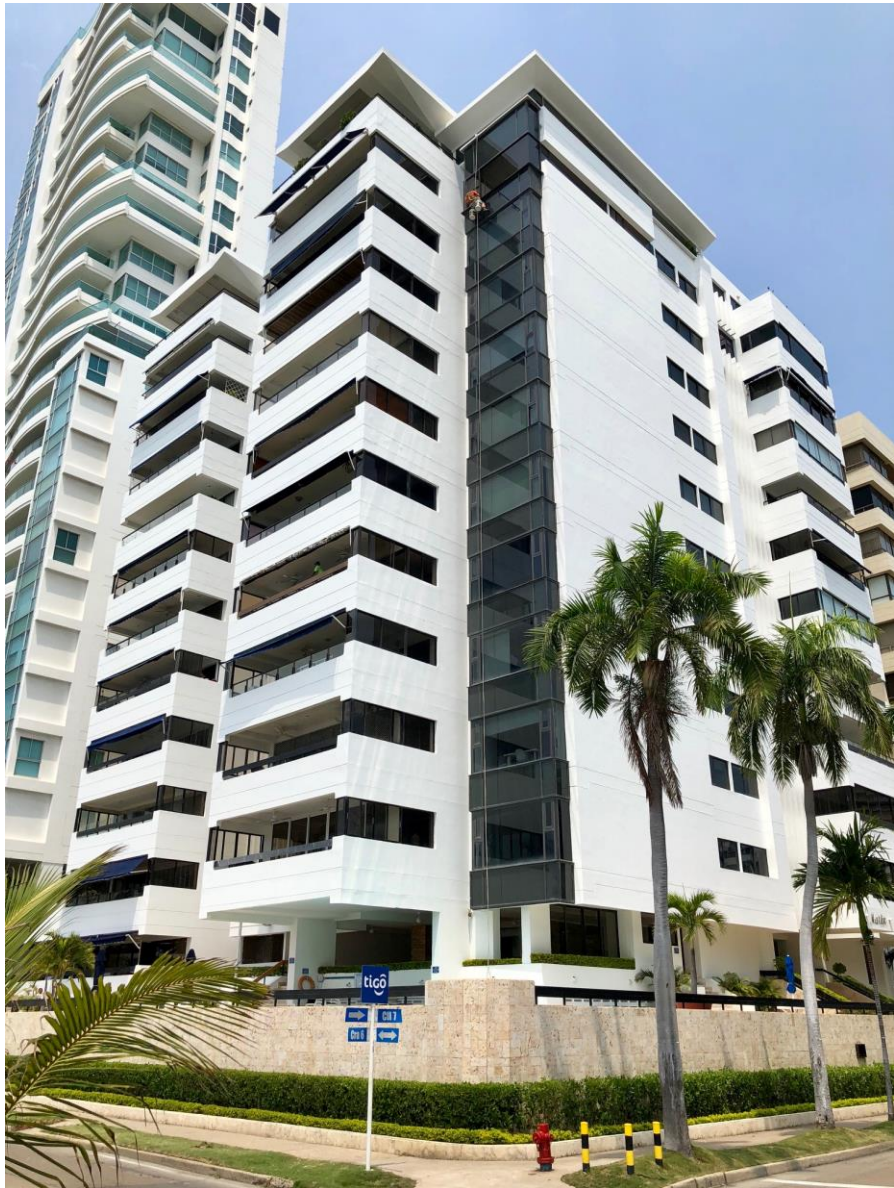
EDIFICIO MARLIN MARINA CLUB