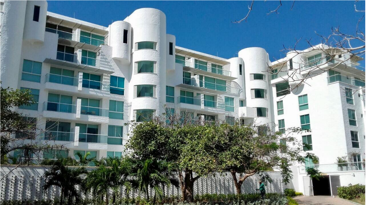
KARIBANA TORRE 1 Y 2

Galería de imágenes de algunos de sus proyectos más recientes: