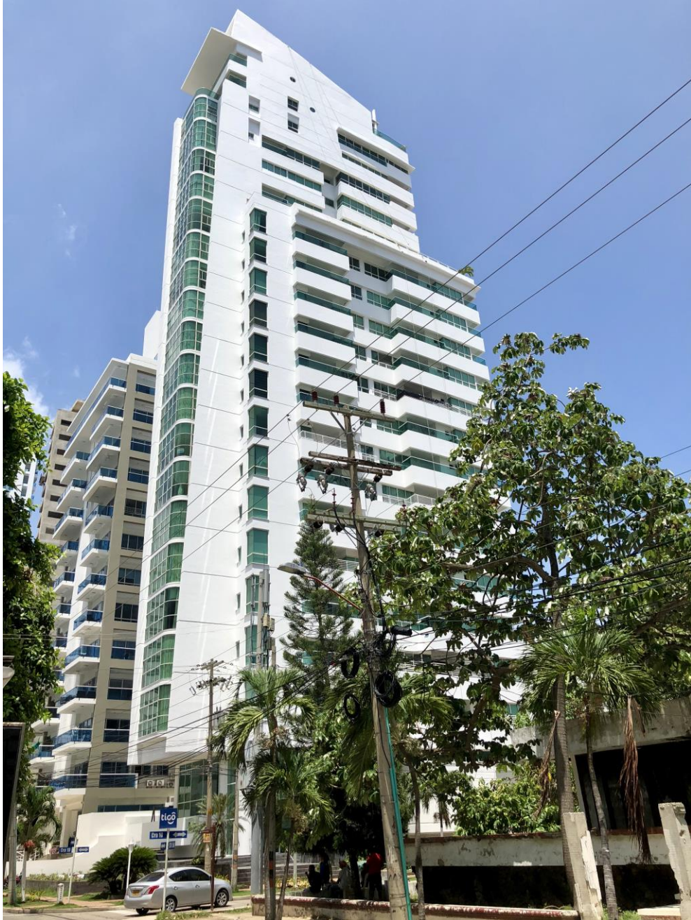
EDIFICIO OMEGA 21